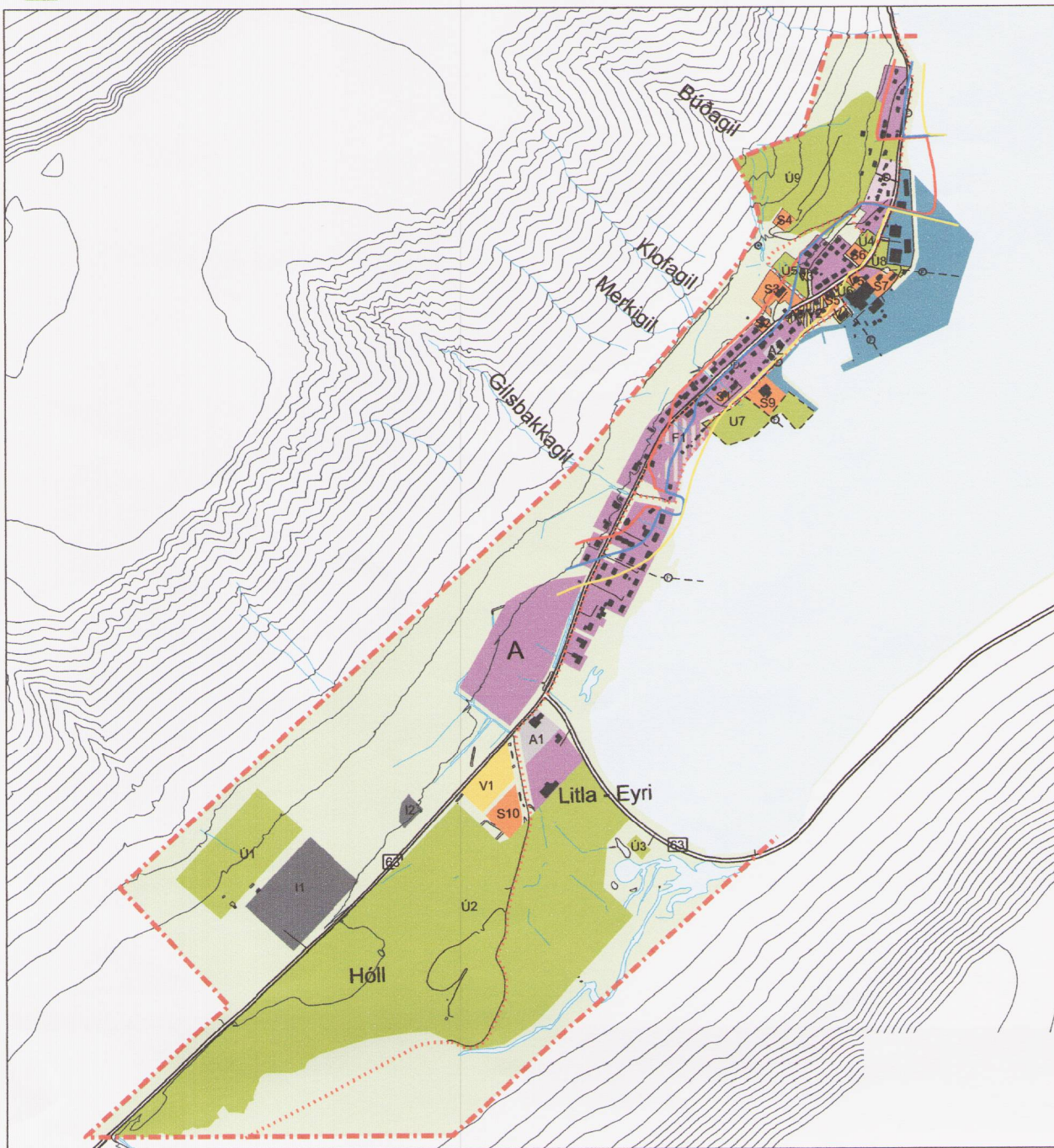
Staðfest aðalskipulag Vesturbyggðar frá 15.12.2006.

Breyting á aðalskipulagi 2006-2018, Bíldudalur