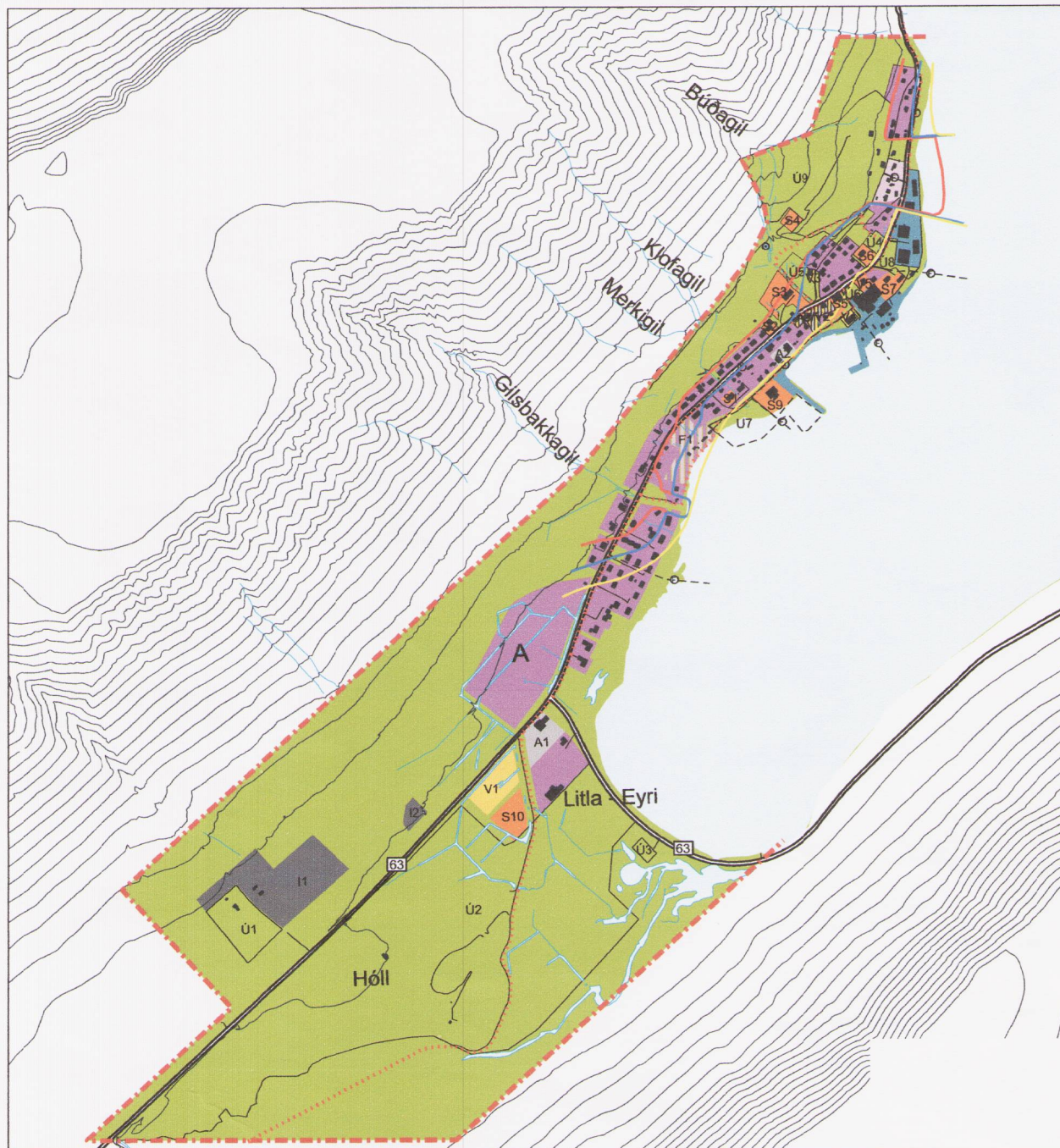
Tilaga að breytingu á aðalskipulagi Vesturbyggðar, dags. 13.11.2012.

Aðalskipulagsbreyting þessi sem auglýst hefur verið skv. 31. gr. skipulagslaga nr. 123/2010 var samþykkt í sveitarsjóð þann 14/4 2013 Aðalskipulagsbreytingin var staðfest af Skipulagsstofnun þann 10/55 2013. Auglýsing um gildistöku aðalskipulagsbreytingar var birt í B-deild Stjórnartíðinda þann 20