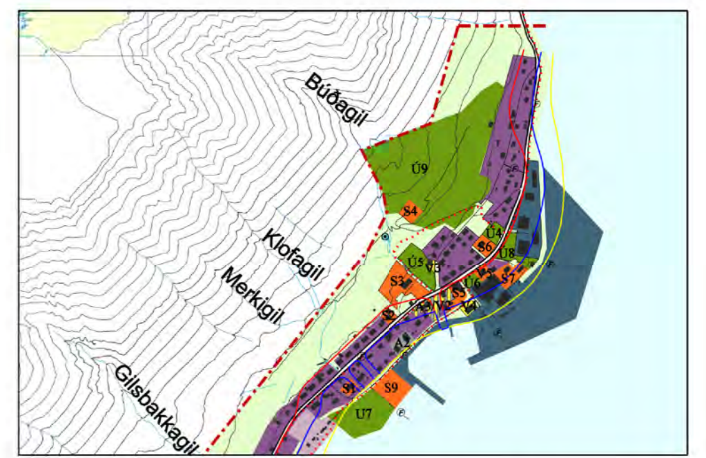
Aðalskipulag Vesturbyggðar 2006-2018, Bíldudalur