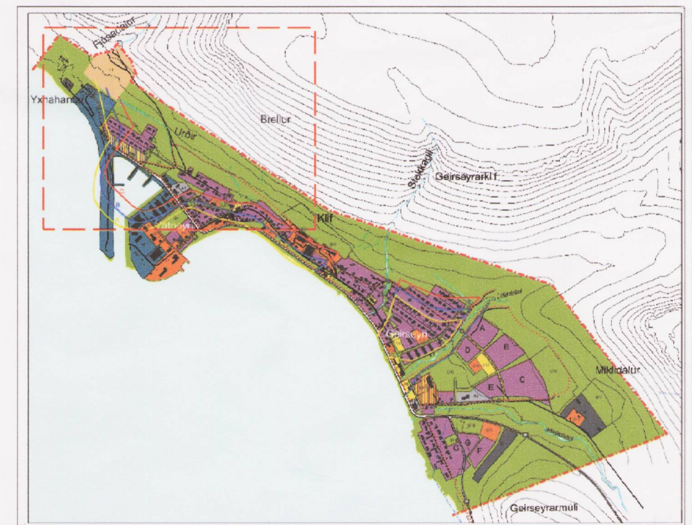
BREYTT AÐALSKIPULAG VESTURBYGGÐAR 2006-2018 MEÐ EFNISLOSUNARSVÆÐI Í VATNEYRARHLÍÐUM

Vegna umsagnar Umhverfisstofnunar sem bárust við deiliskipulag fyrir samvarandi svæði var óskað eftir fundi með Umhverfisstofnun. Fundurinn fór fram 21. mars 2013. Niðurstaða fundarinnar var sú að skilgreina svæðið sem efnislosunarvæði í stað urðunarvæðis þar sem verið er að nýta óvirkan úrgang til að ganga frá svæðinu og bæta stöðugleika hans. Svæðið fær því skilgreiningu sem efnislosunarvæði í aðalskipulagi. Sótt verður því um starfsleyfi til Heilbrigðiseftirlits Vestfjarða fyrir efnislosunarvæði. Greinargerð deiliskipulagsins var því breytt til samræmis við nýja landnotkun. Umhverfisskýrsla helst óbreytt.