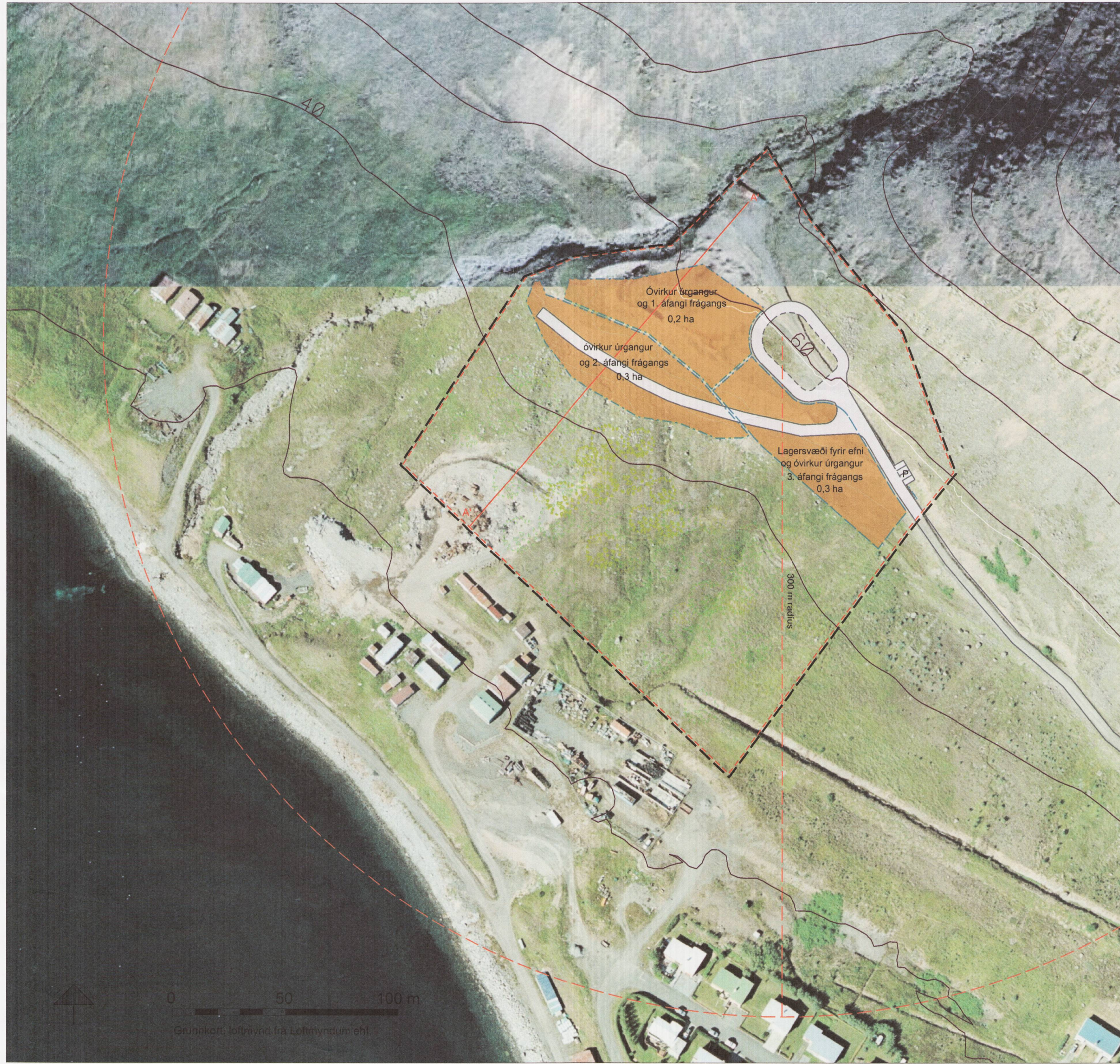
TILLAGA AÐ DEILISKIPULAGI