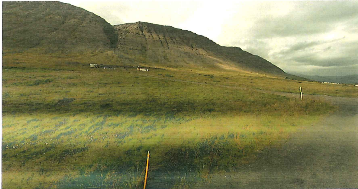
Mynd 1-2. Horft yfir svæðið frá Bíldudalsvegi.