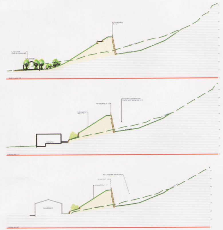
Snið til skýringar