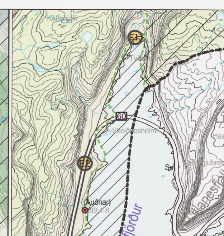
Aðalskipulag Vesturbyggðar, (tillaga að breytingu).