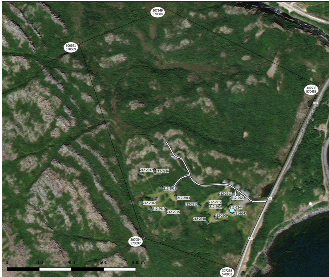
Yfirlitsmynd af skipulagssvæðinu