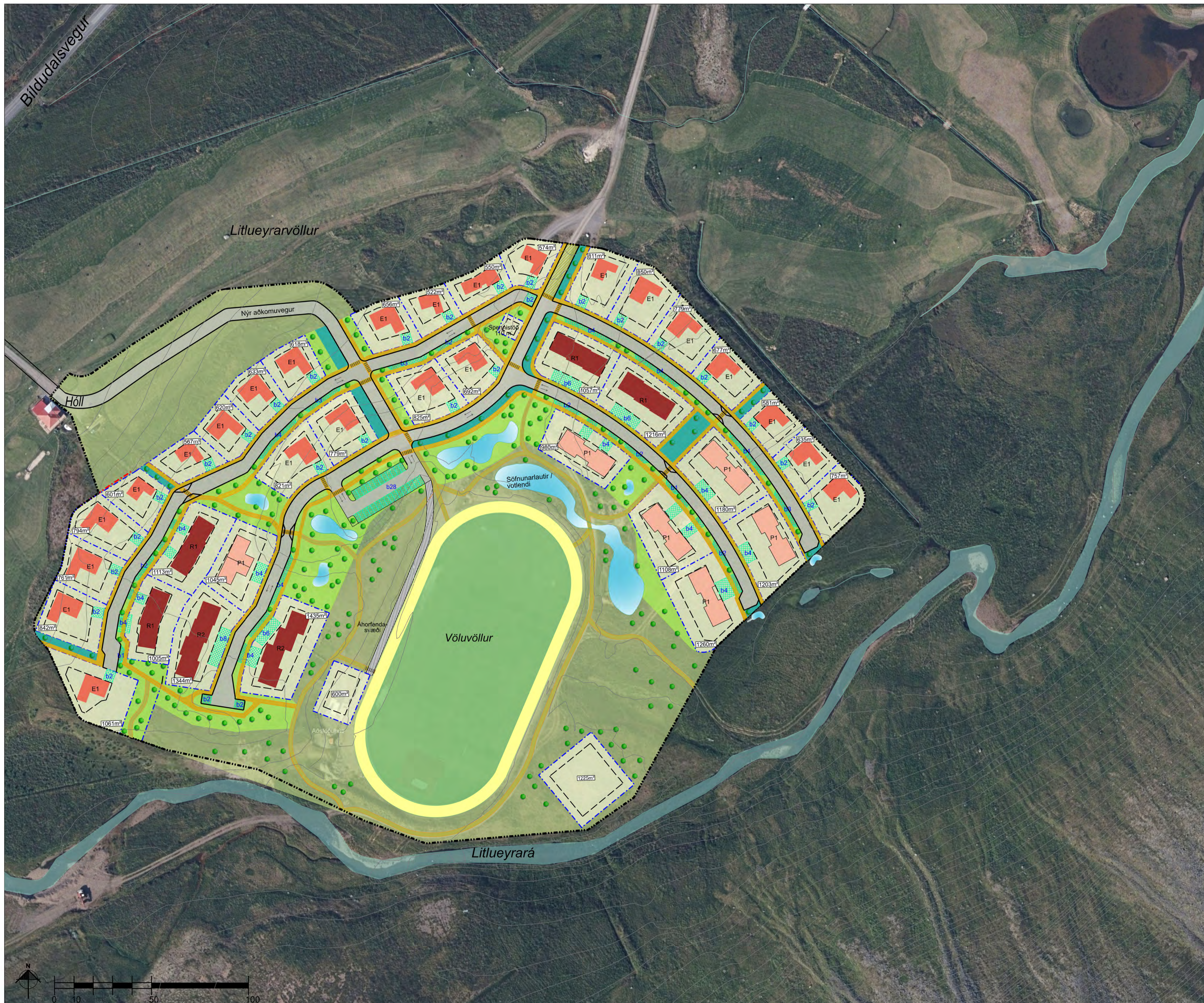
Deiliskipulagsuppráttur Mkv 1:1000