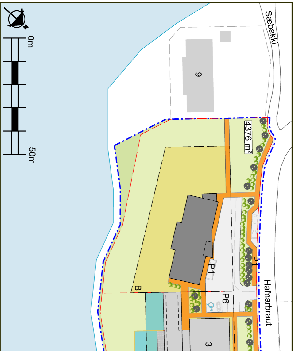
Gildandi deiliskipulag frá maí 2024, mkv. 1:1000