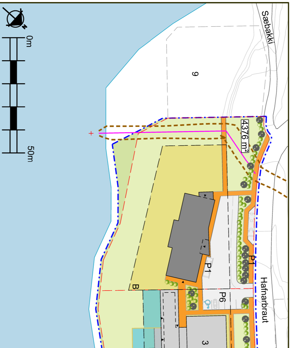
Tillaga að breytingu á deiliskipulagi í nóvember 2024, mkv. 1:1000