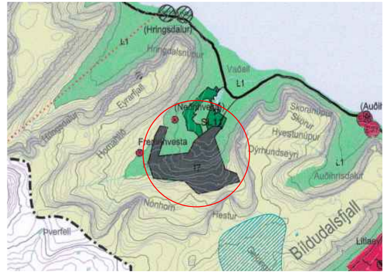
HLUTI ADALSKIPULAGS VESTURBYGGÐAR 2018 - 2035